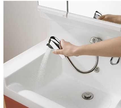
リフト式シングルレバーシャワー水栓

壁に水がはねてカビが発生してしまった… アトレアはそんなお悩みを解決！ ボウルに高さ50mmの『水はねガード』を付け ドライゾーンや壁への水はねをブロック 水の拭き取り掃除をラクにしカビの発生も抑えます